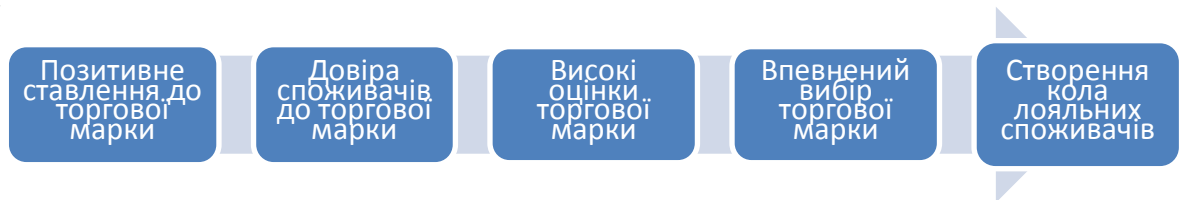
Рис. 1. Модель вибору ТМ на споживчому ринку

Якщо позитивне ставлення до ТМ сформовано, то згідно поетапній моделі вибору ТМ на споживчому ринку, за ним наступними етапами будуть довіра та впевнений вибір її споживачем [3] (рис. 1). Основним напрямом зусиль з формування позитивного іміджу ТМ є створення кола лояльних споживачів, прихильних до певної марки, які і є основним джерелом прибутку підприємств.