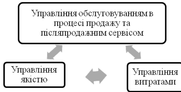
Рис. 1. Складові управління конкурентоспроможністю продукції

Отже, як видно з рис. 1., створення конкурентоспроможної продукції на різних стадіях здійснюється опосередковано через управління процесами її створення і просування.