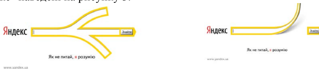
Рис.3 Основні варіанти рекламних звернень ІТ-компанії «Яндекс»

Слід відзначити, що рекламні звернення компанії «Яндекс» були досить лаконічними. Це ставить під сумнів їх інформативність, зрозумілість для споживача, здатність спонукати до використання послуги, що необхідно перевірити у ході дослідження. Основні варіанти рекламного звернення "Яндекс" наведені на рисунку 3.