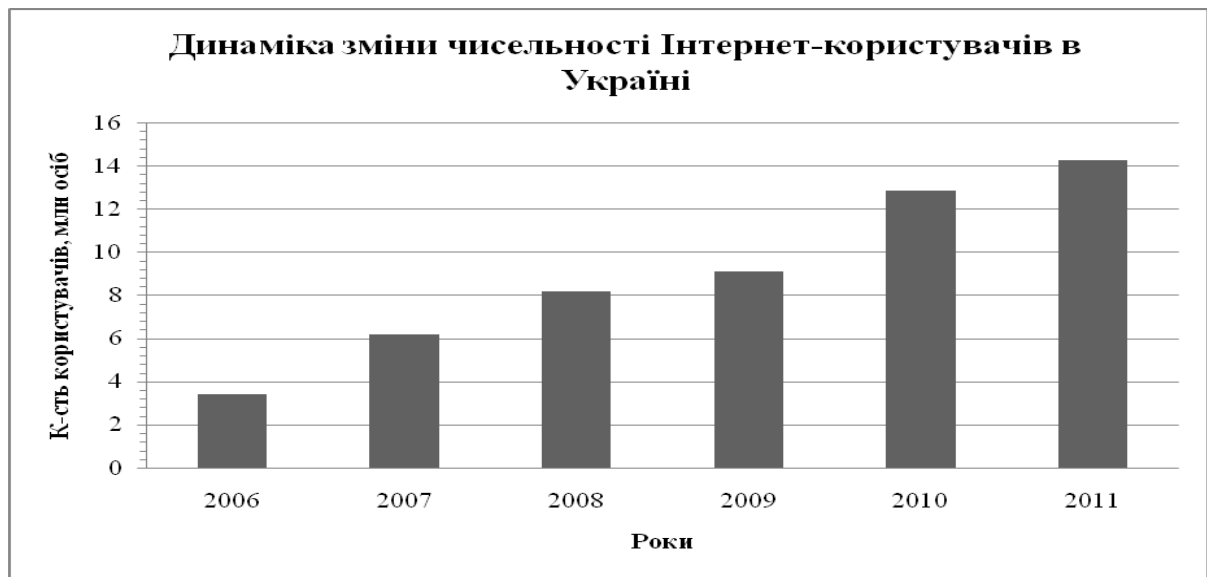
Рис.1 Динаміка зміни чисельності Інтернет-користувачів в Україні [4]

Останнім часом підприємства все частіше звертаються до Інтернет-реклами. Це пов'язане, по-перше, з низькою вартістю цього носія, а по-друге, із розвитком Інтернету. Згідно з новими даними InMind, у вересні 2011 року кількість користувачів Інтернету в Україні склала 14,3 млн (Рис. 1).