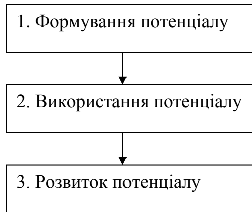
Рис. 1. Схема управління потенціалом підприємства

Федулова Л.І. [2] пропонує послідовність управління потенціалом підприємства через чотирьохрівневу схему управління прибутком, що зображена на рисунку 2. Єгоров А.Ю. [3] та Нікелін Л.Ф.[3], підходять до цього процесу через персонал підприємства, ставлячи акцент на знаннях (кваліфікації та професіоналізмі), а також людському капіталі як головних чинниках економічного зростання.