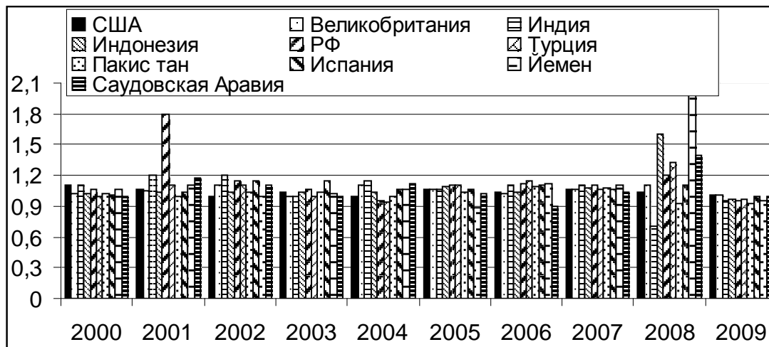
Рис. 1. Динаміка приросту ВВП на душу населення в країнах, які потерпіли від тероризму в 2000 - 2009 рр.,%

Як бачимо, перелічені вище масштабні конфлікти виключають довгострокове економічне зростання ВВП на душу населення. Незважаючи на це, бачимо певну залежність між динамікою приросту показника та вчиненням терористичних дій.